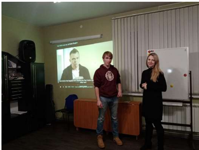
Занятие с наставниками в Иваново

Каждый год Яндекс устраивает большую технологическую конференцию, но в этом году они поменяли формат и сняли фильм, в котором руководители сервисов Яндекса рассказали о новинках в компании и планах на будущее.