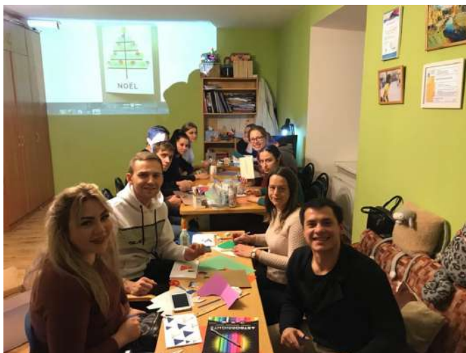
Клуб наставников в Костроме

25 ноября на встрече Клуба наставника в Костроме участники проекта и кандидаты в наставники и подопечные сделали более 20 новогодних открыток для одиноких бабушек и дедушек в Доме милосердия, которых, в рамках социального проекта «Связь поколений» в Костроме, участники фонда «Мы вместе» навещают уже более двух лет, пишут им письма, а в период карантина поддерживают связь удаленно.