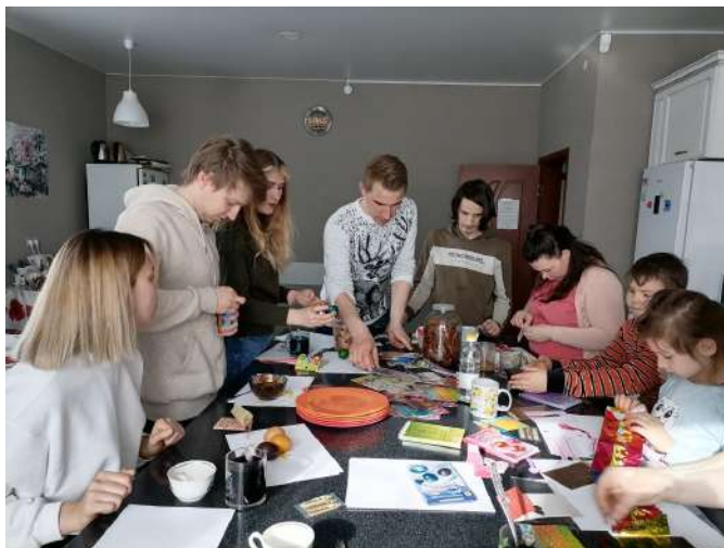
Мастер-класс в Иваново

В ходе мастер-класса участники познакомились с традиционными способами крашения яиц с помощью луковой шелухи и современными способами с помощью пищевых красителей. Затем окрашенные яйца ребята украшали различными материалами: наклейками, стразами, фольгой, цветной термоплёнкой, картонными фигурками. В процессе творческой работы участники узнали информацию о том, как правильно освятить яйца и куличи в храме.