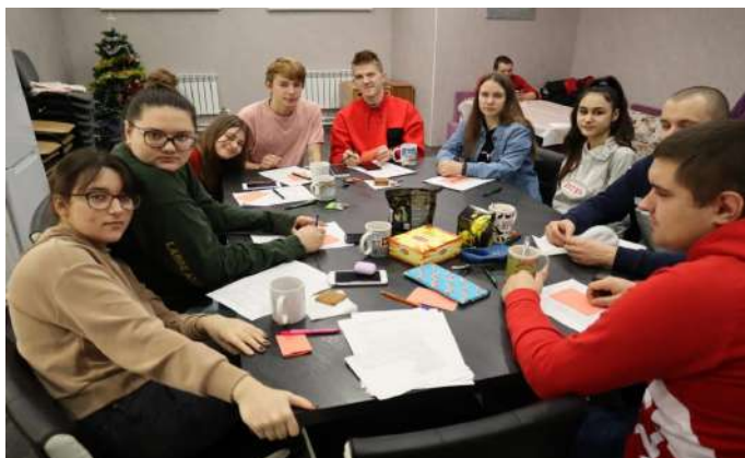
Клуб наставников во Владимире

В январе занятие Клуба наставников во Владимире было посвящено теме выявления и преодоления страхов.