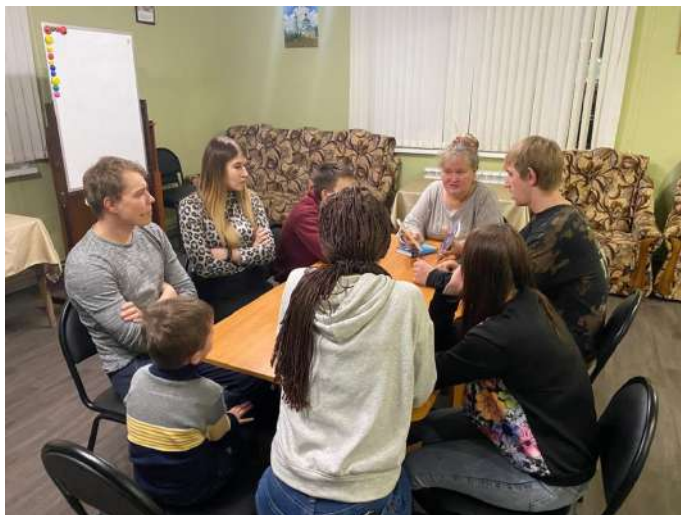
Клубы наставников в Иваново

25 ноября на встрече Клуба наставника в Костроме участники проекта и кандидаты в наставники и подопечные сделали более 20 новогодних открыток для одиноких бабушек и дедушек в Доме милосердия, которых, в рамках социального проекта «Связь поколений» в Костроме, участники фонда «Мы вместе» навещают уже более двух лет, пишут им письма, а в период карантина поддерживают связь удаленно.