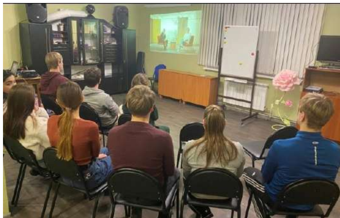
Совместный просмотр фильма в Иваново

Как же с пользой для здоровья и ума провести свое свободное время? Участники программы «Я и мой наставник» Ивановского Центра поддержки выпускников делают для себя новые открытия!