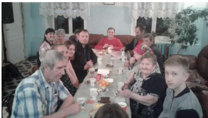
Посещение дома милосердия в Костромской области