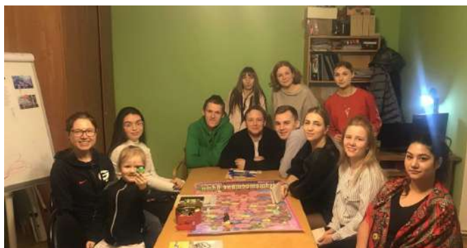
Клуб наставников в Костроме

«Оказывается, мечты и цели — это совершенно разные понятия! Говорят, что мечтать не вредно, но гораздо эффективнее ставить конкретные цели и достигать их. Сегодня я узнала о технологии SMART и с ее помощью сформулировала и расписала по всем пунктам свою цель. Надеюсь, у меня все получится в 2021 году!» — отметила Даша Е.