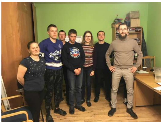
Клуб наставников в Костроме