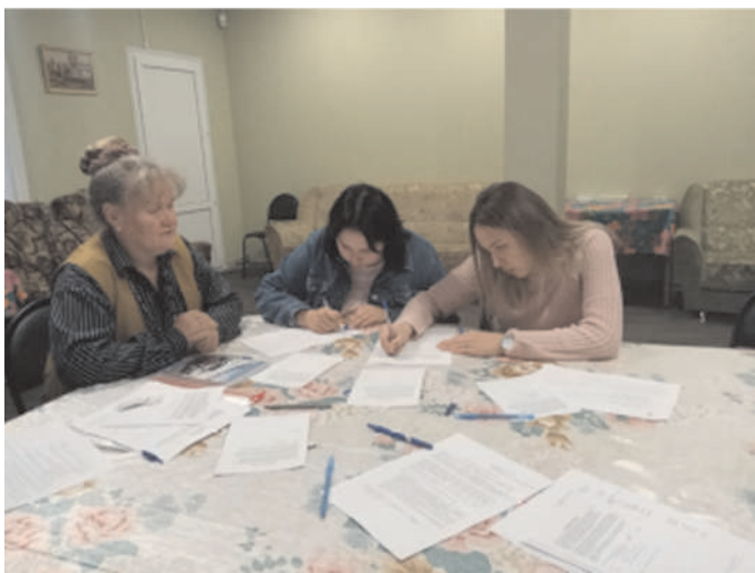
Собеседование пары с координатором во Владимире