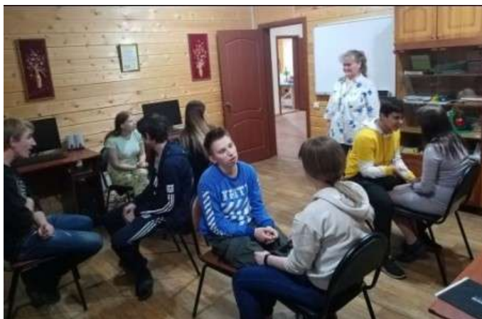
Клуб наставников в Иваново

Вопросам нравственного и духовного развития человека было посвящено очередное занятие в ноябре. Участники семинара обсудили достаточно сложный вопрос оказания помощи в нравственном и духовном воспитании, а лучше сказать, самовоспитании подопечных. Нынешние условия таковы, что молодой человек делает себя сам, а мы, все вокруг, — его помощники, в зависимости от нашей профессии, родственных или дружеских отношений. И в данной ситуации наставник должен проявить гибкость, уметь в нужный момент поддержать, обратить внимание и выделить те духовные качества, которые проявляет подопечный в различных жизненных ситуациях. А для этого и сам наставник должен заниматься самовоспитанием, формировать собственное отношение к тем или иным духовным ценностям.