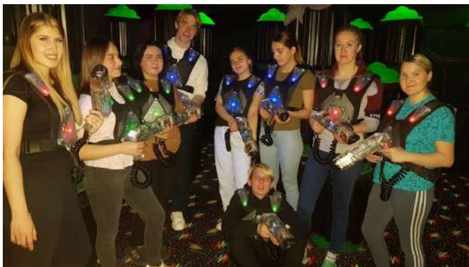
Выход в квест

Массу положительных эмоций получили наставники и подопечные, участвуя в играх, еще лучше узнали друг друга. «Мы — за здоровый и полезный отдых!» — говорят они.