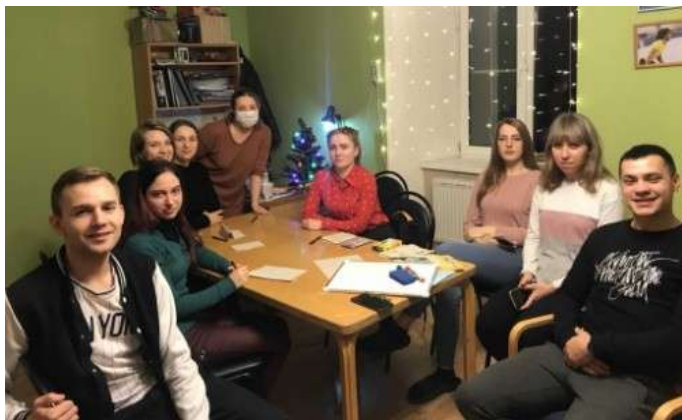
Клуб наставников в Костроме

22 декабря в рамках Клуба наставников в Костроме были организованы две встречи, посвященные теме: «Эмоции. Страх. Стресс и тревожность». Встречи провела психолог фонда «Мы вместе».