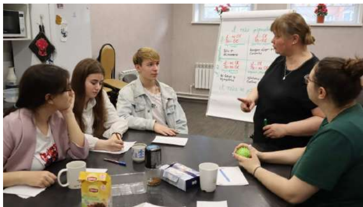
Клуб наставников во Владимире

помощью можно диагностировать устойчивость отношения к себе, фон настроения, адекватность, зрелость, наличие проблем, уровень критичности и требовательности, а также уровень удовлетворенности своей личностью.