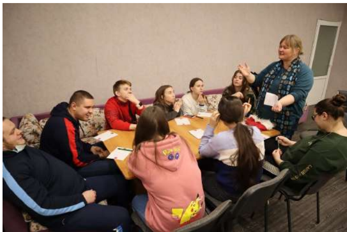
Клуб наставников во Владимире

28 декабря прошел Клуб наставников для участников проекта «Я и мой наставник» во Владимире. Не секрет, что для того, чтобы добиться чего-то в жизни и стать успешным, нужно уметь правильно ставить перед собой цели. Последнюю встречу в этом непростом 2020 году мы решили посвятить знакомству с методикой постановки целей по SMART.