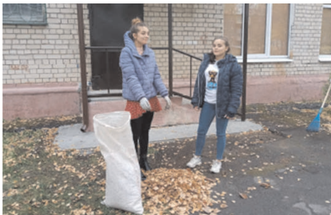
Совместные волонтерские проекты пар в Иваново

Совместные поездки и экскурсии стали очень популярны и помогают сплотить пары «наставник— подопечный».