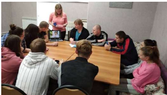
Клуб наставников во Владимире