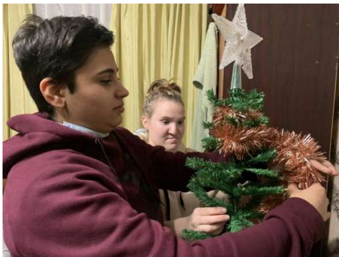
Наставники и подопечные в Иваново

Вторая часть Клуба наставников была посвящена вопросам финансовой грамотности. Очень часто, к сожалению, мы оказываемся в ситуации, когда нам необходимы экстренные расходы: что-то сломалось или порвалось, необходимо оплатить лечение зубов, нужно срочно купить подарок или какой-то предмет первой необходимости и так далее. Что делать в такой ситуации? Брать с долг? В кредит? А, может быть, есть другие способы распоряжения деньгами, которые помогут вам не оказываться в таком положении? Какие есть банковские услуги, которые помогают копить деньги так, чтобы для разных ситуаций у вас были разные кошельки, которые вы можете контролировать?