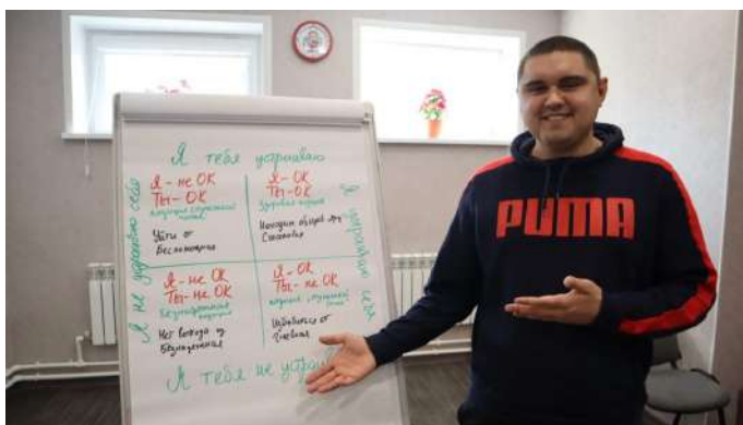
Наставник во Владимире

У выпускников детских домов часто возникают проблемы с самооценкой, что приводит к нестабильной психике, тревожности, обманутым ожиданиям, неадекватным целям и множеству лишних сложностей в жизни.