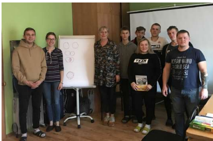
Клуб наставников в Костроме

23 апреля в Костроме прошла встреча Клуба наставников с приглашенным специалистом — психологом на тему «Здоровые привычки: я и гаджеты».