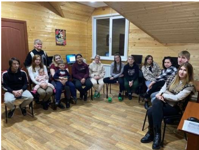
Клуб наставников в Иваново

Вот, например, если мы учимся готовить какое-то блюдо или печь пироги, скажем, наставник рассказал и показал, как он это делает, дал возможность подопечному поделаться все приемы вместе с ним, вместе они приготовили блюдо, напекли пироги. Но является ли этот этап заключительным? Есть ли гарантия, что подопечный научился это делать сам? Оказывается, совсем нет.