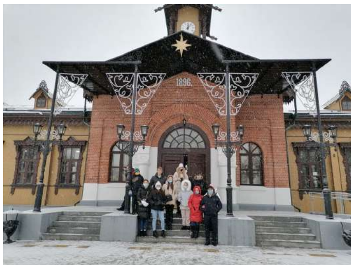
На экскурсии в Шуе

На экскурсии ребята познакомились с профессией мыловара, у них возникло очень много вопросов по предпринимательской деятельности: где покупать сырье, как реализовывать товар, как заключать договора с партнерами, как пришлось искать сбыт во время пандемии, как планируется расширение производства и многое другое.