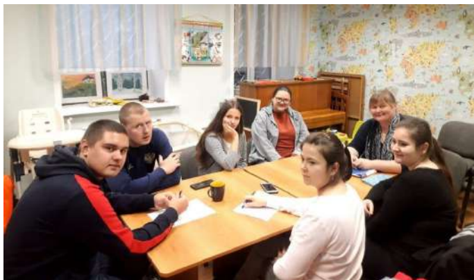
Клуб наставников во Владимире

В октябре в Ивановском центре поддержки выпускников собирались участники программы «Я и мой наставник», чтобы обсудить очень серьезный для них вопрос «Что такое доверие?»