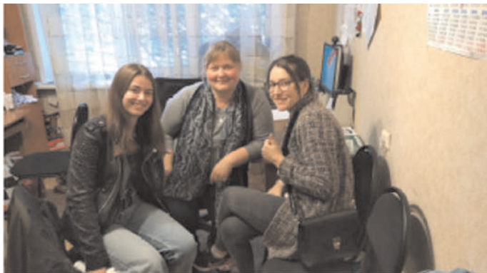
Заполнение анкет в Иваново

В нашем проекте «Я и мой наставник» принимали участие 42 выпускника детских домов, подростки, находящиеся в трудной жизненной ситуации, дети из приемных семей. Все они являлись либо студентами, либо одинокими мамами и родителями. В совместной работе пар, где участники – молодые мамы или молодые семьи из числа выпускников детских домов или приемных семей, уделялось особое место созданию и укреплению детско-родительских отношений. Многие наставники имели двух или даже трехгодичный опыт, а некоторые наставники в прошлом сами были подопечными.