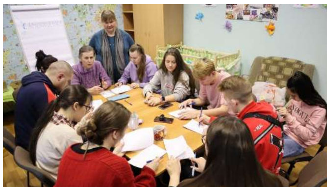
Клуб наставников во Владимире

Результаты диагностики показали, что у большинства ребят уровень самооценки значительно занижен. На занятии в апреле наставники и подопечные продолжили работать над повышением самооценки и безусловным принятием себя. Молодые люди также познакомились с предложенным американским психологом и психиатром Эриком Берном понятием «окейность», узнали, как отношение к себе и окружающим может влиять на качество жизни. Встреча закончилась чтением декларации самооценности.