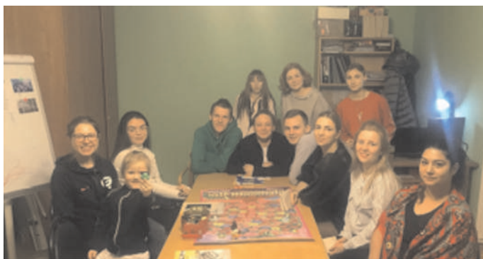
Клубы наставников в Костроме