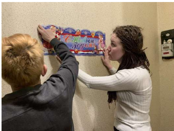
Пары в Иваново