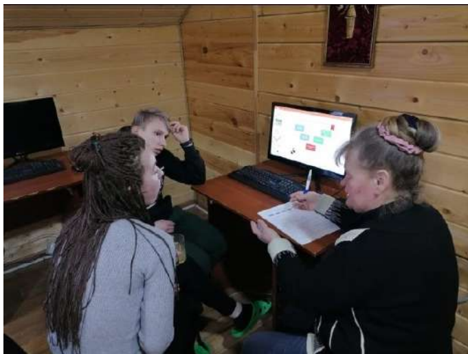
Встреча пары с координатором в Иваново

Умению управлять эмоциями было посвящено занятие Клуба наставников, которое состоялось 21 февраля во Владимире. С помощью различных упражнений участники учились чувствовать свои эмоции, давать им характеристику, переживать их и отпускать после этого. Отдельно остановились на том, как контролировать гнев, чтобы он не приводил к агрессии. Ребята поделились своими способами управления эмоциями, среди которых были занятия спортом и танцами, музыка, прогулки, использование прохладной воды и другие.