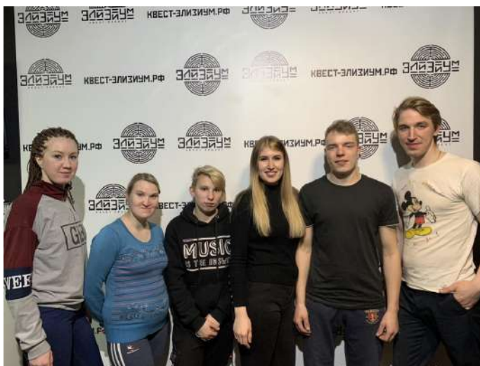
Совместный выход в квест

Как же с пользой для здоровья и ума провести свое свободное время? Участники программы «Я и мой наставник» Ивановского Центра поддержки выпускников делают для себя новые открытия!