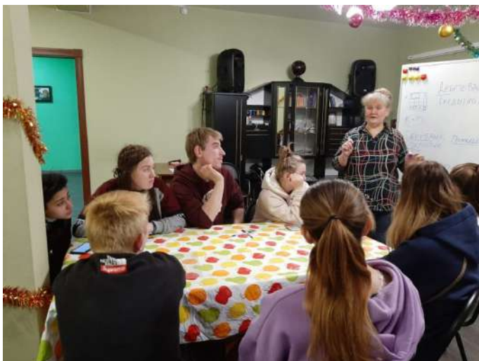
Клуб наставников в Иваново

Вторая часть Клуба наставников была посвящена вопросам финансовой грамотности. Очень часто, к сожалению, мы оказываемся в ситуации, когда нам необходимы экстренные расходы: что-то сломалось или порвалось, необходимо оплатить лечение зубов, нужно срочно купить подарок или какой-то предмет первой необходимости и так далее. Что делать в такой ситуации? Брать с долг? В кредит? А, может быть, есть другие способы распоряжения деньгами, которые помогут вам не оказываться в таком положении? Какие есть банковские услуги, которые помогают копить деньги так, чтобы для разных ситуаций у вас были разные кошельки, которые вы можете контролировать?