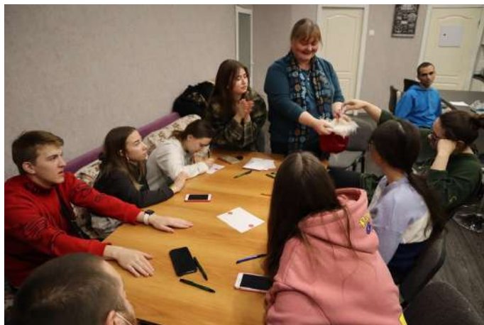
Клуб наставников во Владимире

Встреча завершилась чаепитием и поздравлениями друг друга с Новым годом. Желаем нашим наставникам и подопечным успешной реализации всех поставленных целей!