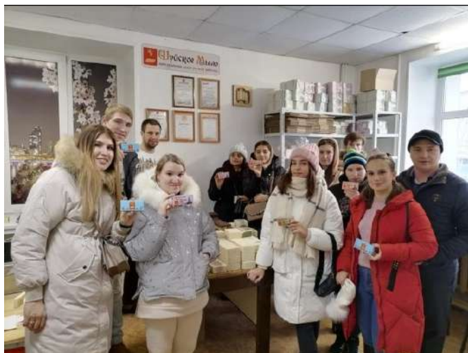
Поездка участников проекта в Шую

На экскурсии ребята познакомились с профессией мыловара, у них возникло очень много вопросов по предпринимательской деятельности: где покупать сырье, как реализовывать товар, как заключать договора с партнерами, как пришлось искать сбыт во время пандемии, как планируется расширение производства и многое другое.